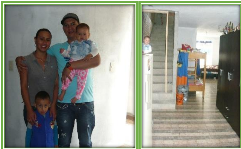
Familia Herrera Jaramillo: Programa de Construcción

Proyectos: 80 Personas beneficiadas 298 Inversión en miles: $843.922