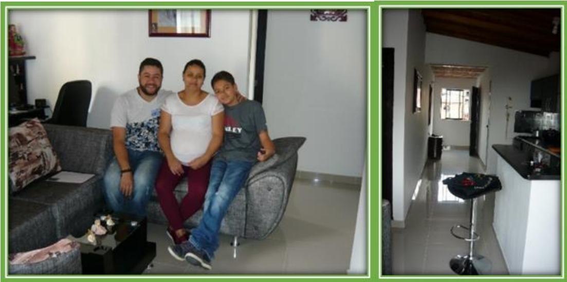
Familia Grisales Restrepo: Programa de Mejoramiento